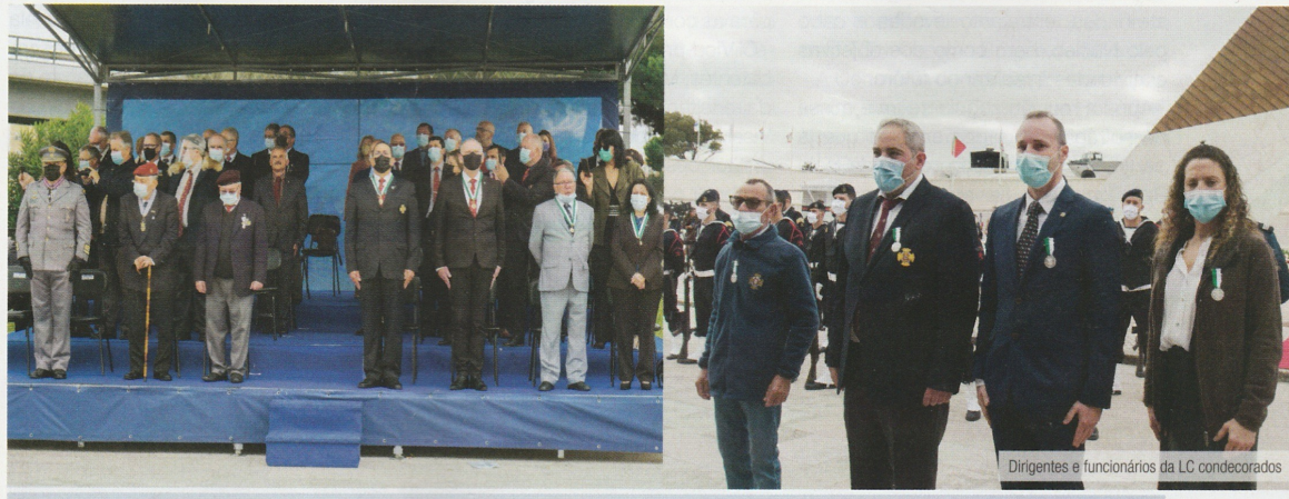
Dirigentes e funcionários da LC condecorados