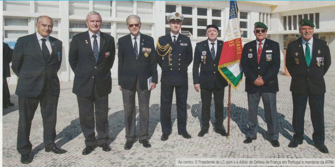
Ao centro: O Presidente da LC com o a Adido de Defesa de França em Portugal e membros da ATRN